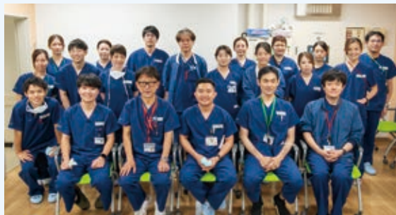
麻酔科のみなさんと