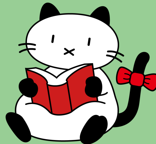
マスコットキャラクター ないとちゃん

開館時間 8:00～24:00 通常(有人)開館時間 8:30～17:00(平日)